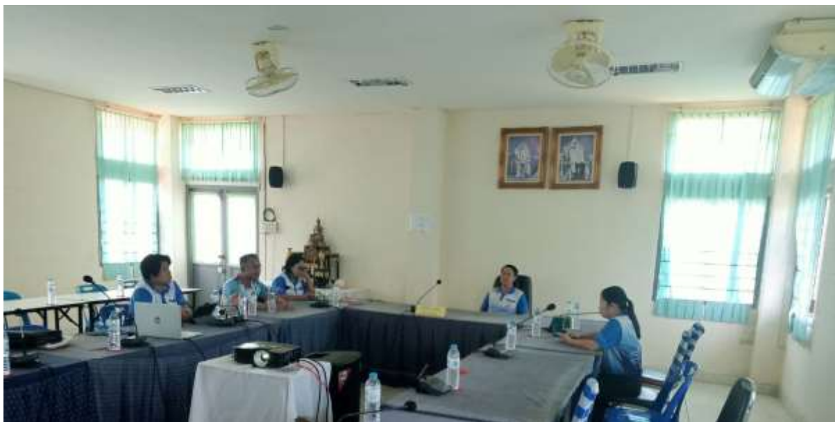
จัดประชุมจัดทำแผนบริหารความเสี่ยงการทุจริต