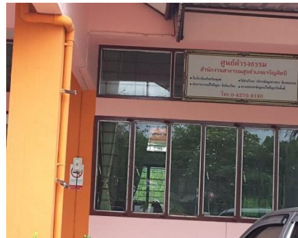
ศูนย์ดำรงธรรม