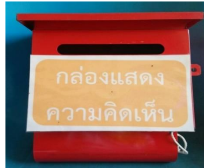
ยื่นโดยตรงกล่องรับความคิดเห็น