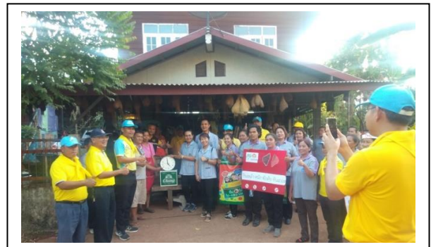
ภาพการ รณรงค์ในชุมชน ขับรถเปิดไฟ ใส่หมวกกันน็อก ตักเตือนกลุ่มเสี่ยงชุมชน และตรวจตราร้านค้า และกำชับให้จำหน่ายเครื่องดื่มแอลกอฮอล์ตามกฎหมาย