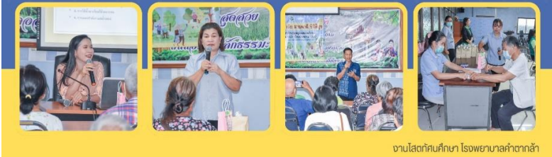
งานสัปดาห์ทันตกรรม โรงพยาบาลคำตากล้า

กลุ่มงานบริการด้านปฐมภูมิและองค์รวม โรงพยาบาลคำตากล้า ได้มีการดำเนินโครงการ "ผู้สูงวัย สายตาดำดี ซีวีมีสุข ประจำปี 2567" วันที่ 29 มีนาคม 2567 ณ ห้องประชุมโรงพยาบาลคำตากล้า ซึ่งได้รับสนับสนุนงบประมาณจากกองทุนหลักประกันสุขภาพองค์การบริหารส่วนตำบลคำตากล้า โดยได้มีการดำเนินการตรวจวัดสายตาฟรีในผู้สูงอายุ ที่สายตาผิดปกติ พร้อมแก้ไขปัญหาส่งพบจักษุแพทย์ และวัดสายตาประกอบแว่น จำนวน 50 ราย